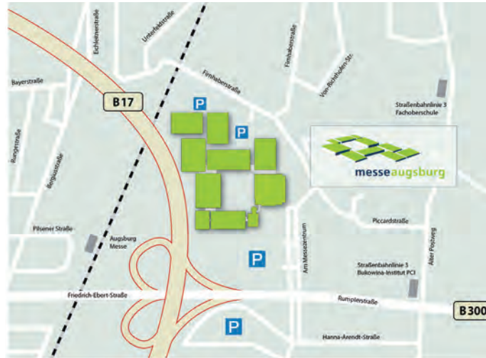
Messe Augsburg Am Messezentrum 5 · 86159 Augsburg · www.messeaugsburg.de

Das Vortragsprogramm „Holzbau“ wird ausgerichtet vom Netzwerk Holzbau im Rahmen des Regionalmanagements der Regio Augsburg Wirtschaft GmbH für den Wirtschaftsraum Augsburg und findet im Rahmen der Augsburger Immobilientage 2014 statt. Das ZIM-Projekt „HOLZ+ Holzverbundlösungen“ präsentiert sich auch im Jahr 2014 mit seinem Arbeitsprogramm und Projektinhalten.